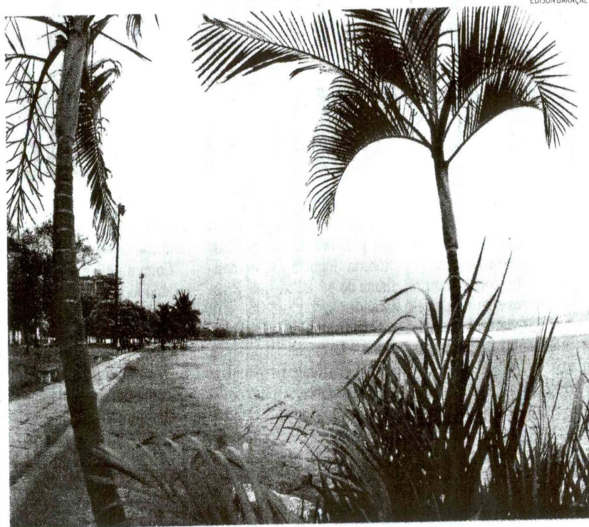
A tranquilidade da Praia da Enseada dará lugar este mês a uma programação de esportes e lazer infantil

As atividades serão realizadas de segunda a sexta, das 8 às 12 horas e das 13 às 17 horas. As inscrições são no local. Basta os pais ou responsáveis assinarem um termo autorizando a participação das crianças.