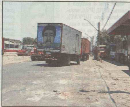
Codesp quer acabar com os congestionamentos na Rua do Adubo

até a metade do ano. E as intervenções não terminarão por aí.