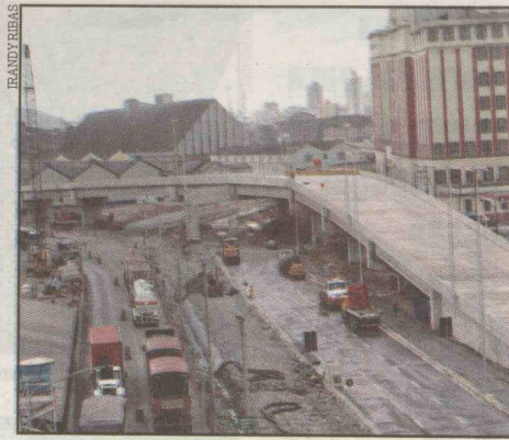
Trânsito em Santos melhorou com a entrega do primeiro viaduto

Já na parte de Guarujá, o buraco é mais embaixo. A obra não ficará pronta em 2010, como o próprio José Roberto Serra admitiu. O projeto executivo estará finalizado até março. A ideia da estatal é colocar a licitação na rua a partir de abril deste ano e começar os trabalhos na Av. Santos Dumont e na Rua do Adubo